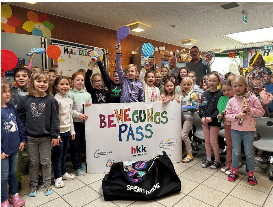
Beste Schule in der Stadt: St.-Martinus-Grundschule-Himmelsthür