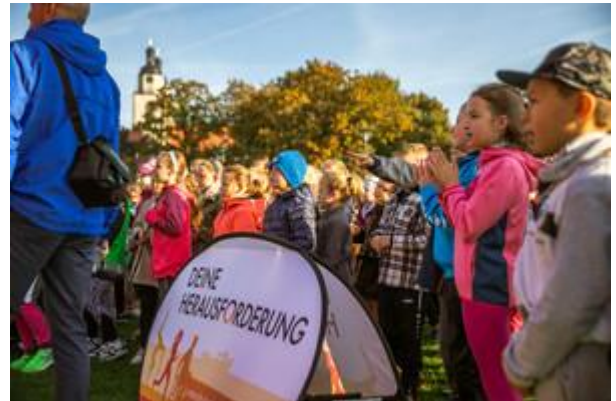
Voller Vorfreude

Alle freuen sich schon jetzt auf neue gemeinsame Abenteuer – im nächsten Sommer bei der Sportabzeichen-Tour 2023!